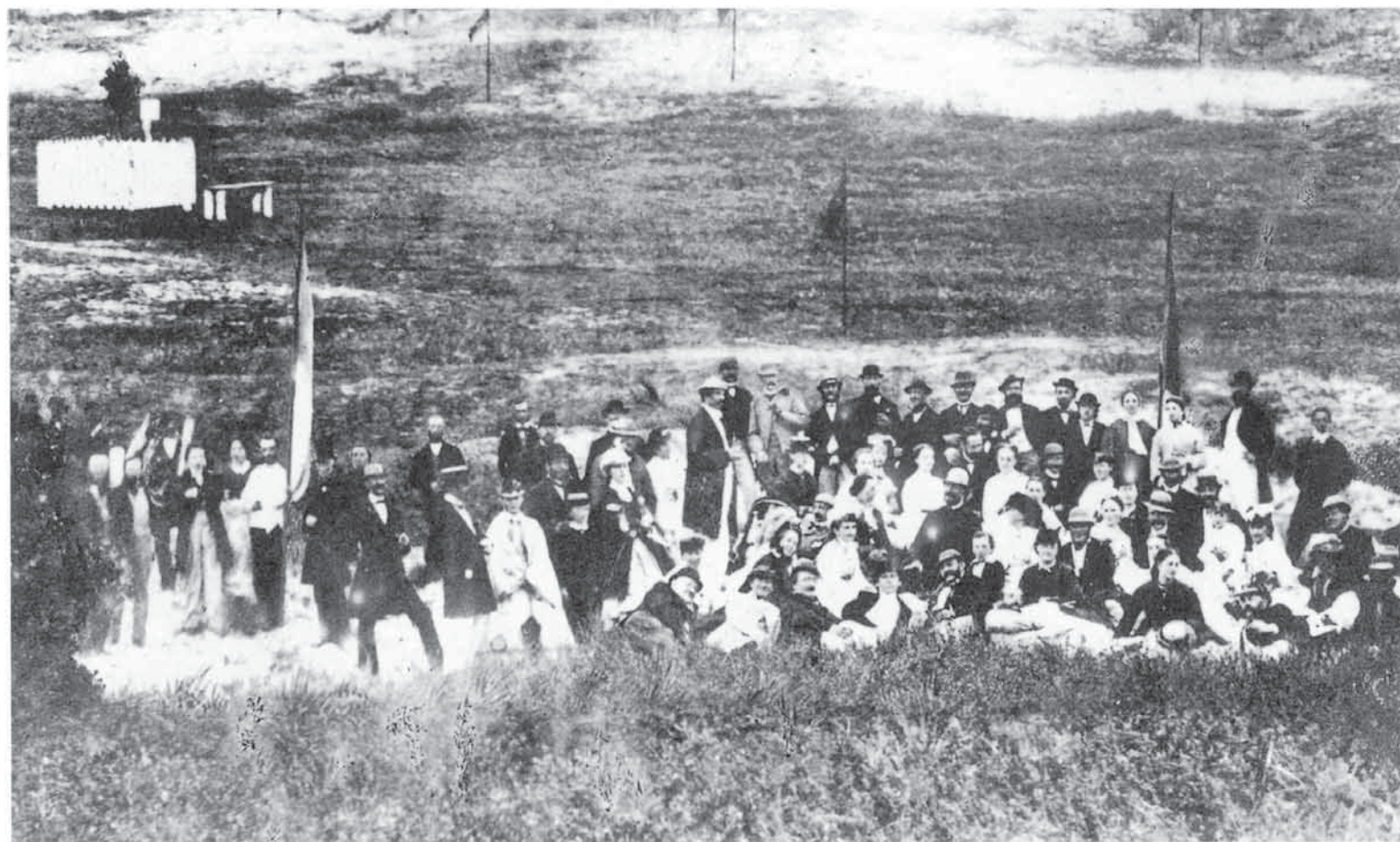
Foto unten: Picknick der hannoverschen Hofgesellschaft im „Hirrenfiern“, 1865. In der Bildmitte, sitzend mit weißem Hut, König Georg V. von Hannover. Im Hintergrund links, der 1861 gepflanzte Lebensbaum zur Erinnerung an die Rettung des Kronprinzen.

Auf Befehl des Königlich-Preussischen Civil-Commissars für Hannover wies der Auricher Landdrost Erxleben am 8. August das Amt Berum an, „die auf Norderney beabsichtigte Aufstellung des Denkmals für Seine Königliche Hoheit den Kronprinzen von Hannover am 10. D. M. unverzüglich, nöthigen Falls pr. Expressen, zu verbieten“. Der Bade-Inspektor Schulze sollte dazu erst die Genehmigung aus Hannover einholen. Jedoch auf Norderney wollte man nicht darauf warten. Zwar hatte sich nach Erhalt des Schreibens der Amtmann aus Berum sofort nach Norderney begeben, mußte jedoch feststellen, dass man das Monument bereits am 9. August errichtet hatte. Der 10. August wäre „in aller Ruhe verlaufen, die Insulaner hatten in gewohnter Weise geflagget“. Schon am 11. August verfügte der Civil-Commissair von Hardenberg, „daß es nach der bereits erfolgten Aufstellung des Denkmals für Sr. Königlichen Hoheit den Kronprinzen bei den factischen Verhältnisse sein Bewenden haben möge“. Nur mit der Finanzierung des Denkmals mußten sich der Gemeindevorsteher und der Gemeindeausschuss, die sich darüber zerstritten hatten, noch über ein halbes Jahr lang beschäftigen.