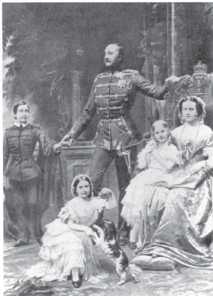
Die Königliche Familie (Nach dem Ölgemälde von Fritz Kaulbach, 1957) – links Kronprinz Ernst August, König Georg V., Königin Marie mit Prinzessin Marie, davor Prinzessin Friederike

Die Denkmalsbezeichnung „Cumberland“ leitet sich, wie vorstehend angeführt, vom Titel des ersten hannoverschen Königs Ernst August ab, den ebenso sein Sohn Georg und Enkel Ernst August trugen. Cumberland ist die nordwest-