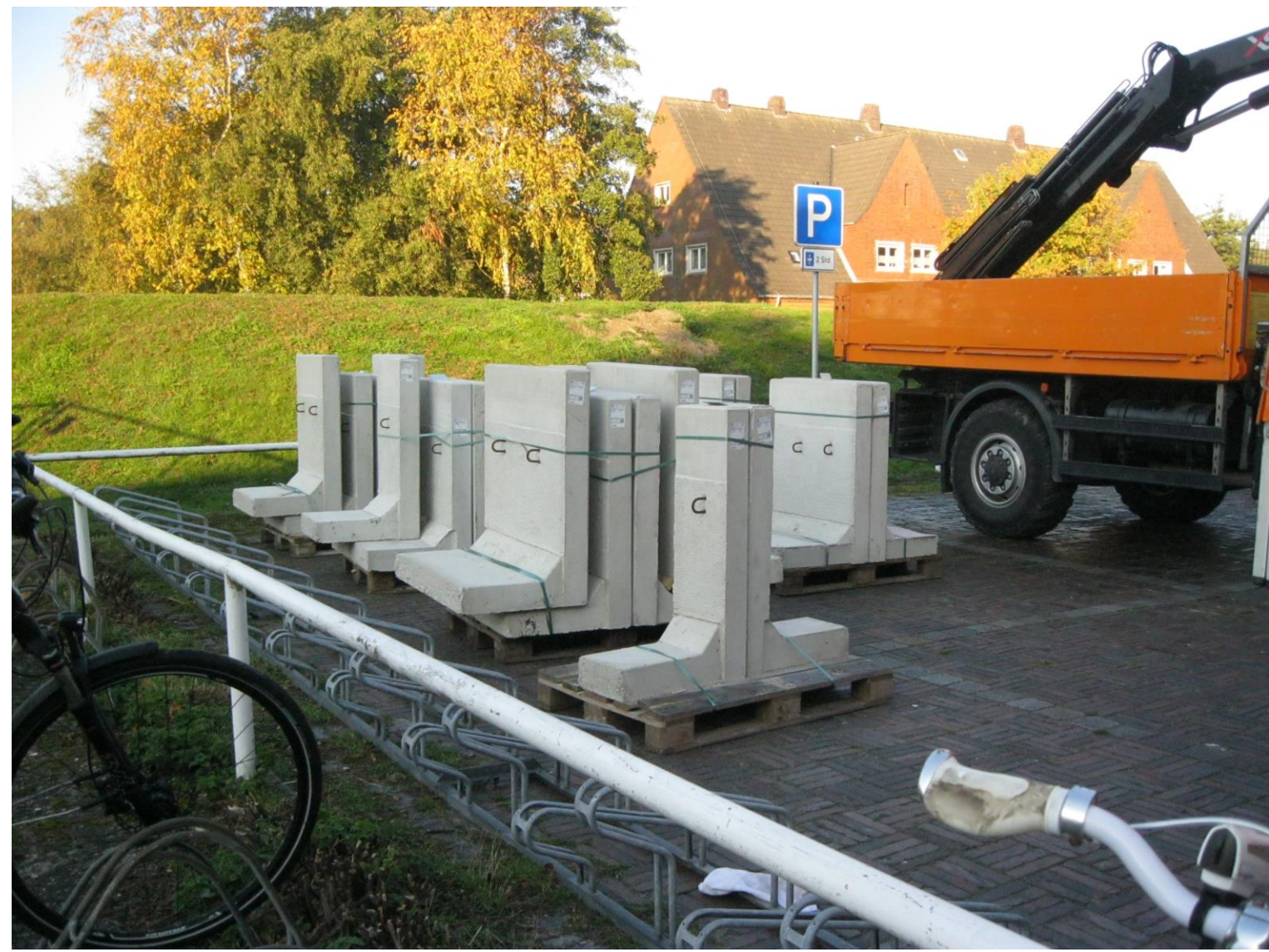
Der „Quartiersumbau An der Mühle“ wurde gefördert durch das Programm „Sanierung kommunaler Einrichtungen in den Bereichen Sport, Jugend und Kultur“