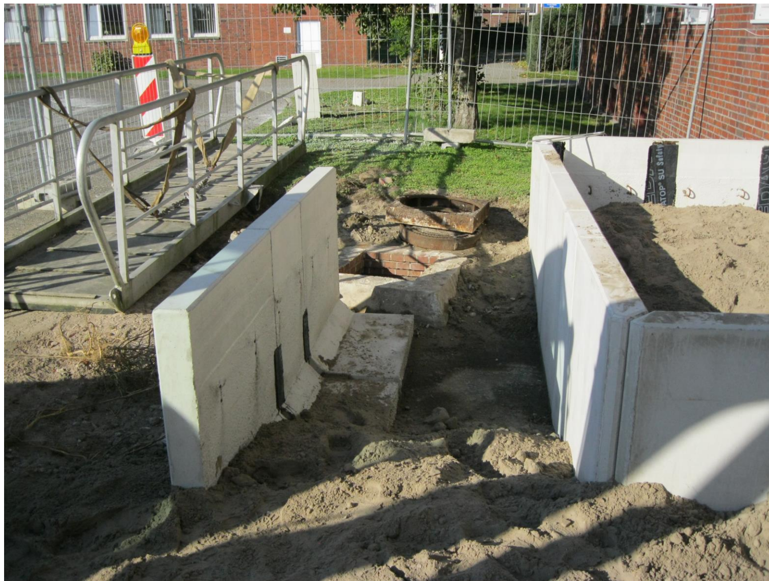
Der „Quartiersumbau An der Mühle“ wurde gefördert durch das Programm „Sanierung kommunaler Einrichtungen in den Bereichen Sport, Jugend und Kultur“