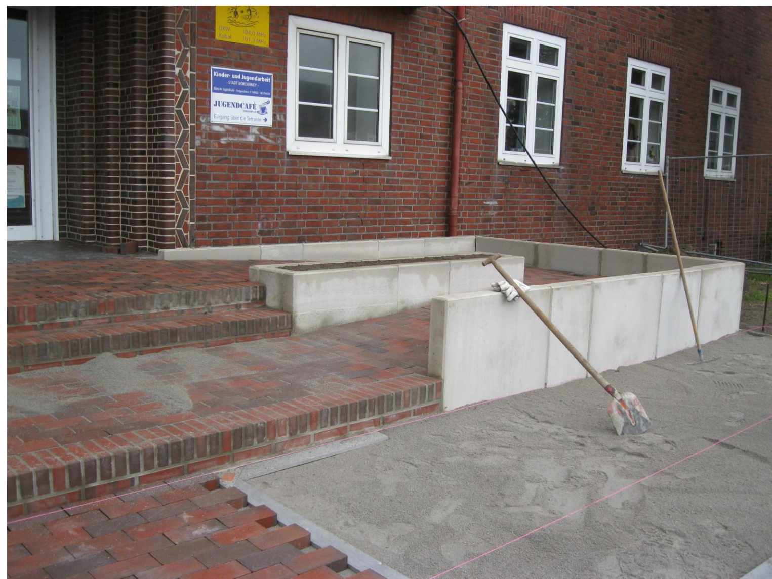
Der „Quartiersumbau An der Mühle“ wurde gefördert durch das Programm „Sanierung kommunaler Einrichtungen in den Bereichen Sport, Jugend und Kultur“