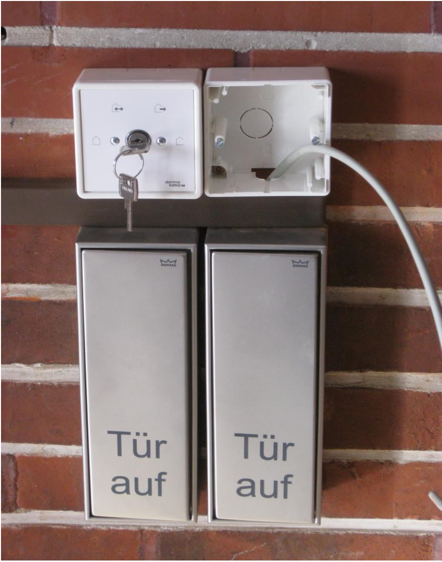
Der „Quartiersumbau An der Mühle“ wurde gefördert durch das Programm „Sanierung kommunaler Einrichtungen in den Bereichen Sport, Jugend und Kultur“