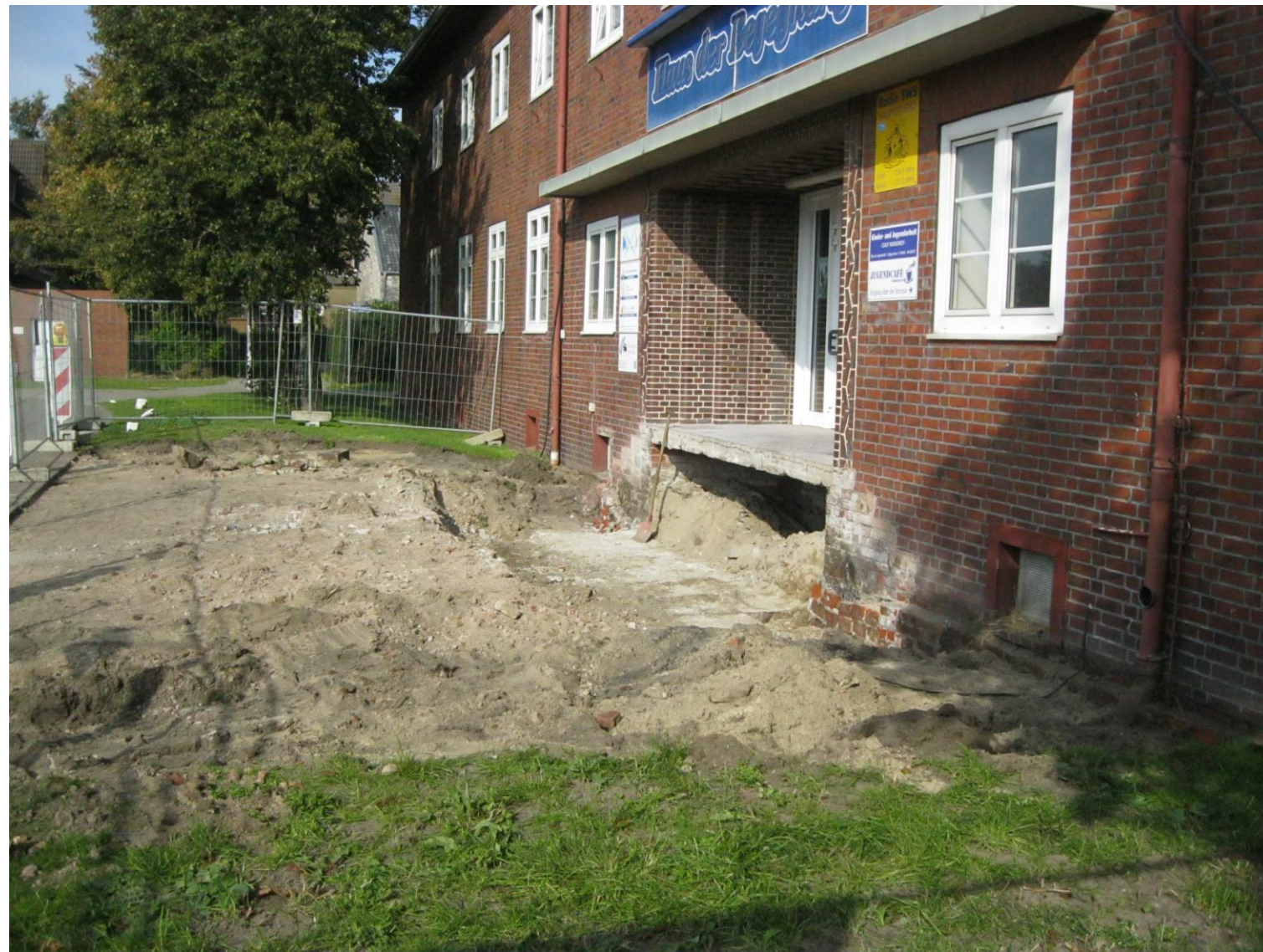
Der „Quartiersumbau An der Mühle“ wurde gefördert durch das Programm „Sanierung kommunaler Einrichtungen in den Bereichen Sport, Jugend und Kultur“