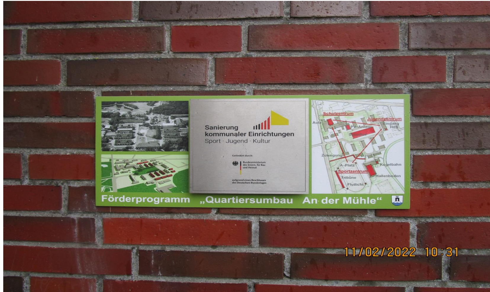
Der „Quartiersumbau An der Mühle“ wurde gefördert durch das Programm „Sanierung kommunaler Einrichtungen in den Bereichen Sport, Jugend und Kultur“