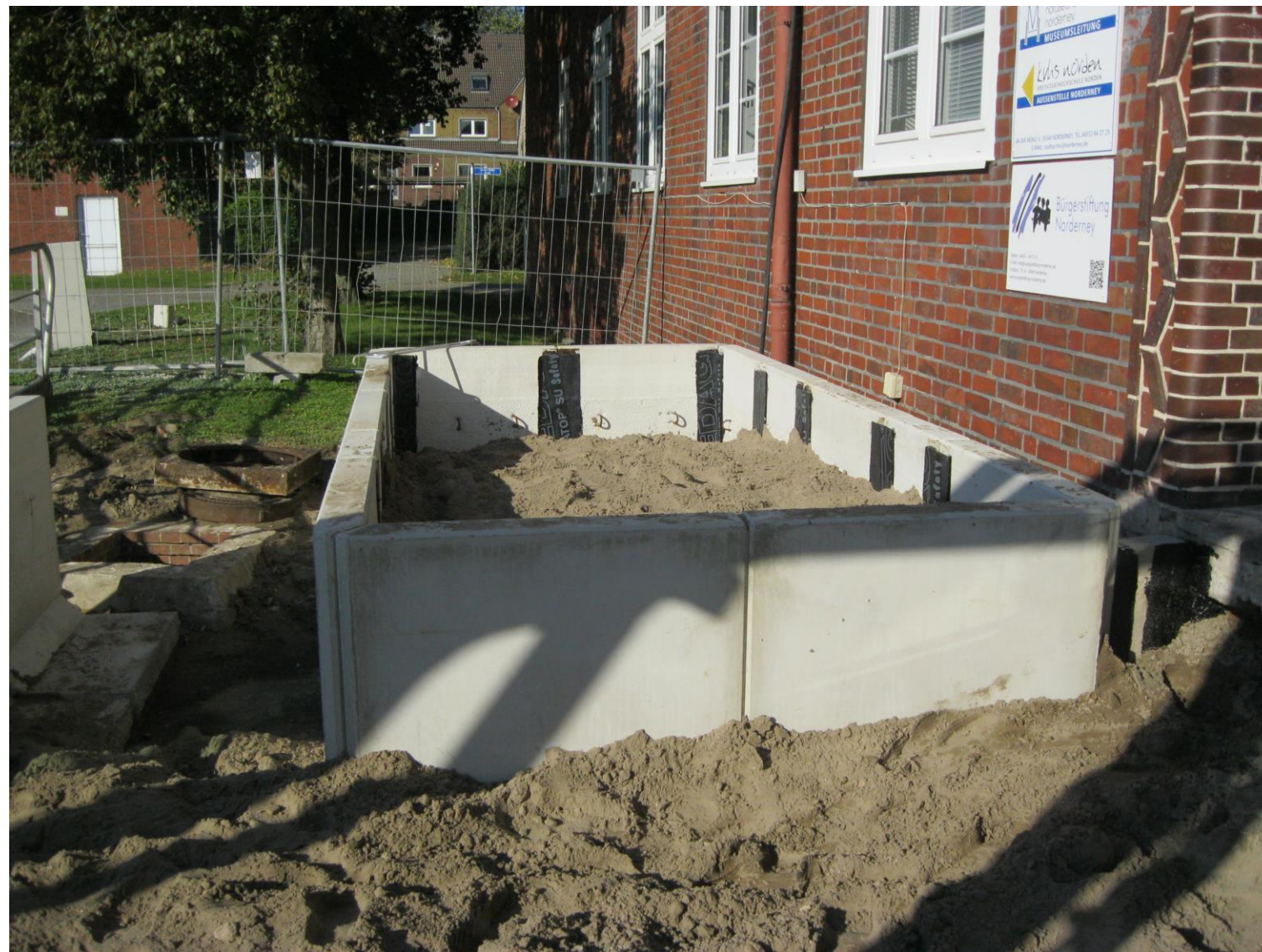
Der „Quartiersumbau An der Mühle“ wurde gefördert durch das Programm „Sanierung kommunaler Einrichtungen in den Bereichen Sport, Jugend und Kultur“