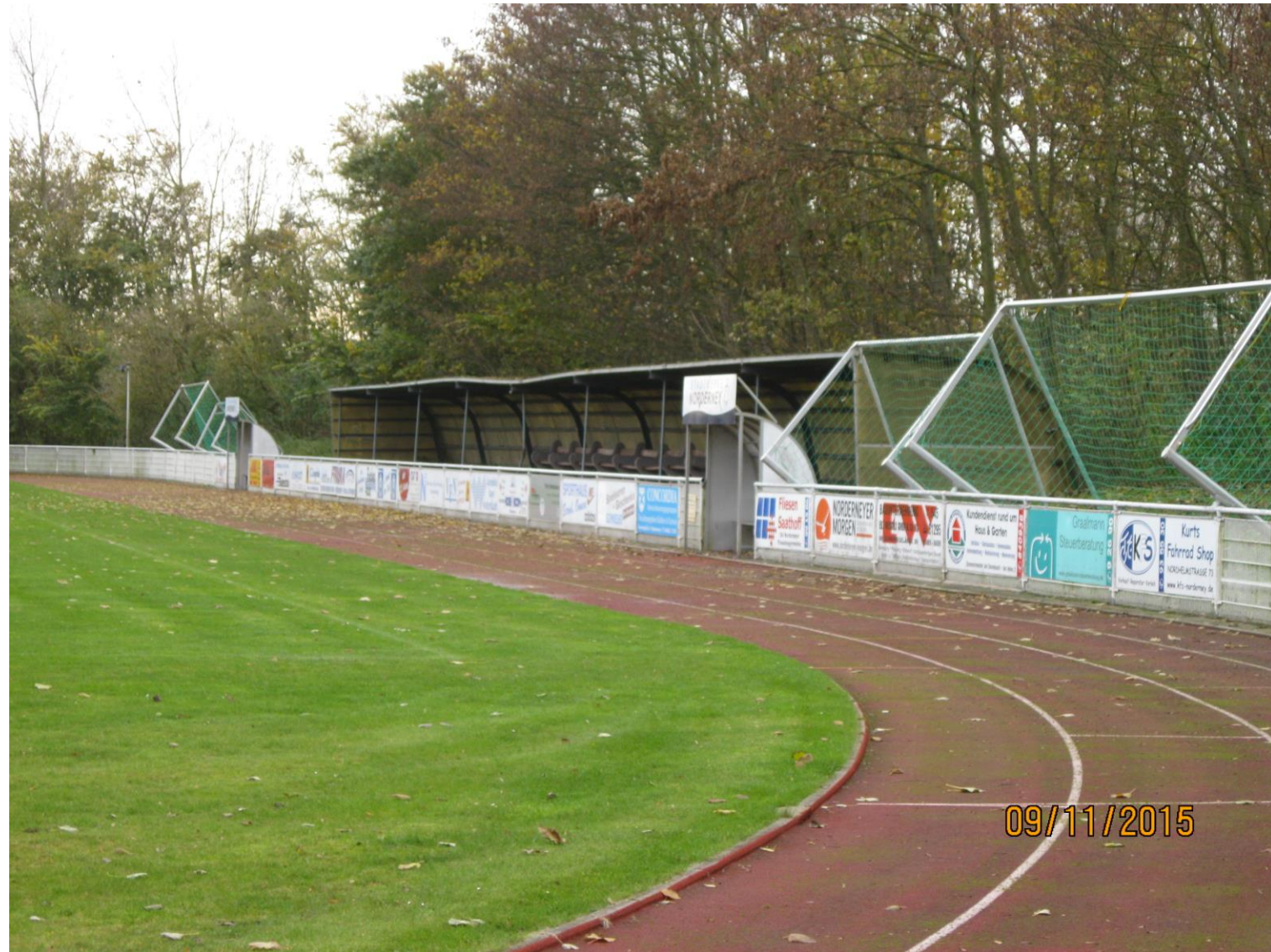
Der „Quartiersumbau An der Mühle“ wurde gefördert durch das Programm „Sanierung kommunaler Einrichtungen in den Bereichen Sport, Jugend und Kultur“