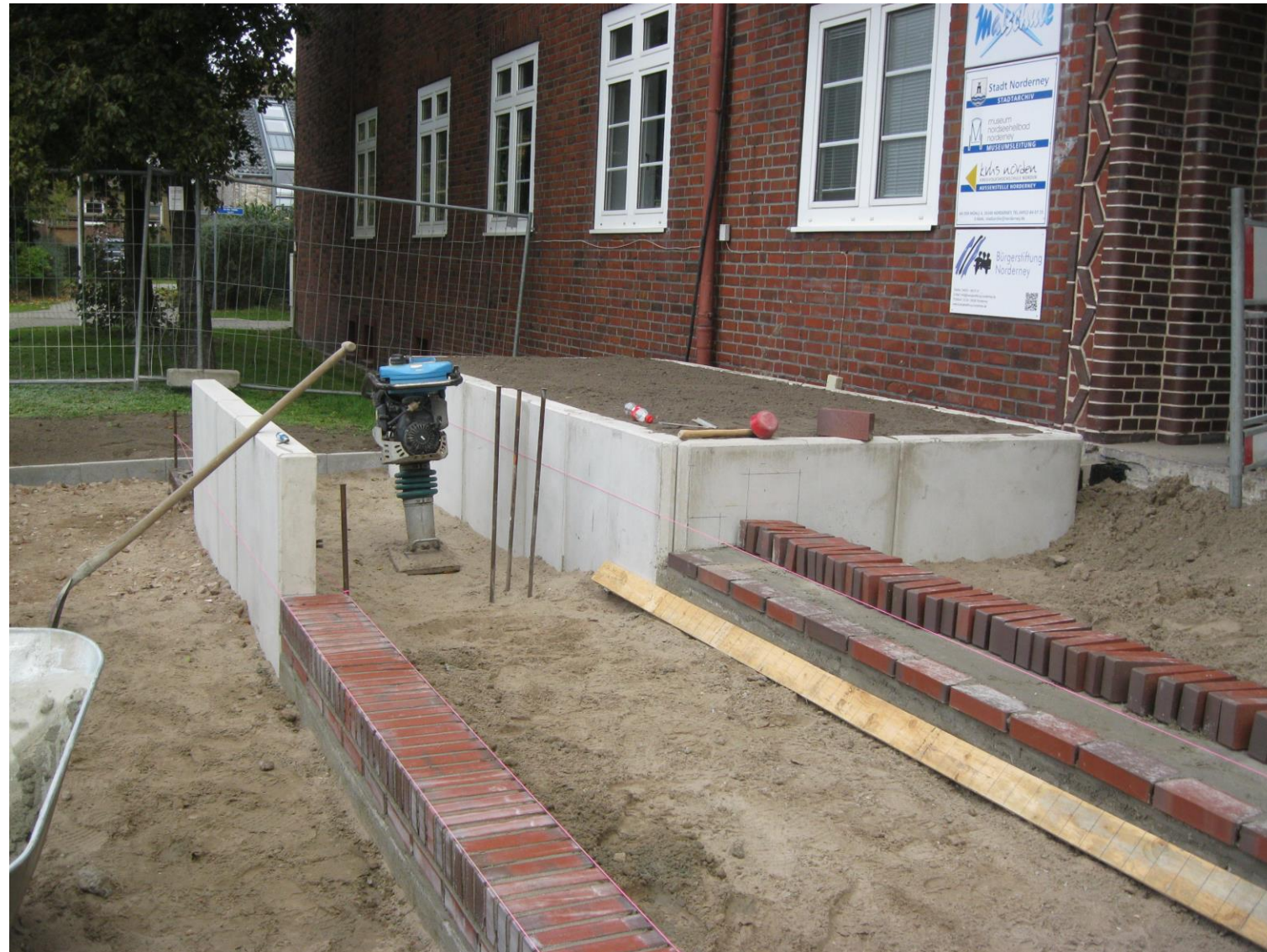
Der „Quartiersumbau An der Mühle“ wurde gefördert durch das Programm „Sanierung kommunaler Einrichtungen in den Bereichen Sport, Jugend und Kultur“